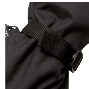
>> Zugverschluss im Handgelenkbereich

Die Schutzhandschuhe für den Bereich Funktechnik.