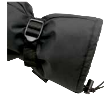
>> Zugverschluss im Einschlußbereich (nur beim NETWORKER ISO)