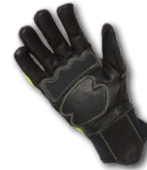
>> Innenhand mit aufgenähten Verstärkungen und Abpolsterungen