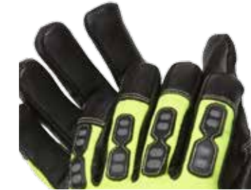
>> Protektoren auf den Fingern