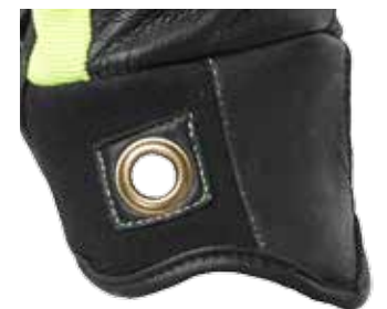
>> Öse an der Stulpenseite

Dieser besonders angenehm zu tragende Spezial-Schnitzzschutzhandschuh ist entwickelt worden, um Ihre Hände gegen mechanische Risiken, besonders Schnittverletzungen, zu schützen.