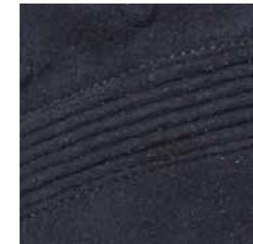
>> Geraffte Abpolsterung im Fingergelenk- und Knöchel-Bereich