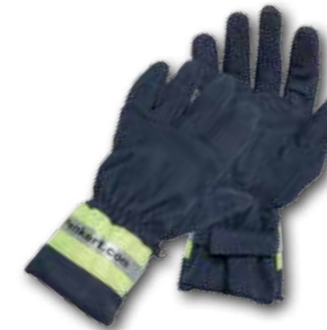
>> JUNIOR POWER: Amara-Leder

Schutzhandschuh aus Amara-Leder mit Stulpe und umlenkbarem Klettverschluss.