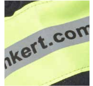
>> Stulpe mit Reflexstreifen

Dieser besonders leichte und bequeme Handschuh ist entwickelt worden, um Ihre Hände gegen mechanische Risiken zu schützen.