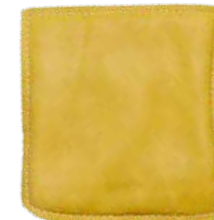
>> Mehrlagige Schnitzzschutzeinlage aus 100% KEVLAR® mit Nappaleder