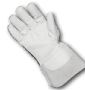
>> Innenhand aus geschmeidigem, hydrophobiertem Rindnarbenleder

Schnitzzschutzhandschuh mit mehrlagiger KEVLAR®-Schnitzzschutzeinlage.