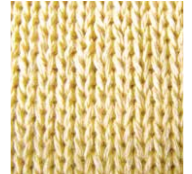
>> Handteil aus schnitzzfestem KEVLAR®-Interlock

Dieser besonders angenehm zu tragende Handschuh ist entwickelt worden, um Ihre Hände gegen mechanische Risiken, besonders bei Baumfällarbeiten und Arbeiten mit einer handgeführten Kettensäge, zu schützen.