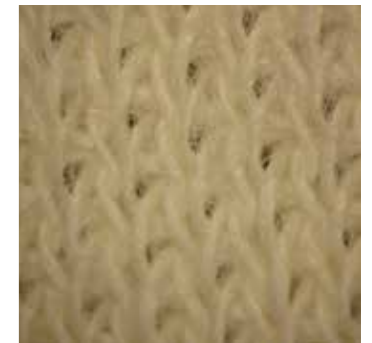
>> Schnittschutzeinlage Doubleface-Strickware