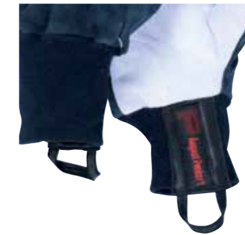
>> REBEL / STRICK: Nomex®-Strickbund und Lederschlaufe