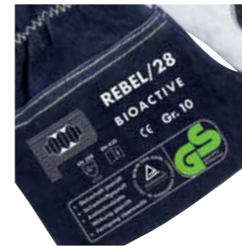
>> GS - geprüft

Der Sicherheitsrevolutionär aus dem Hause Penkert.