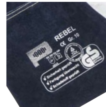
>> GS - geprüft

Der Sicherheitsrevolutionär aus dem Hause Penkert.