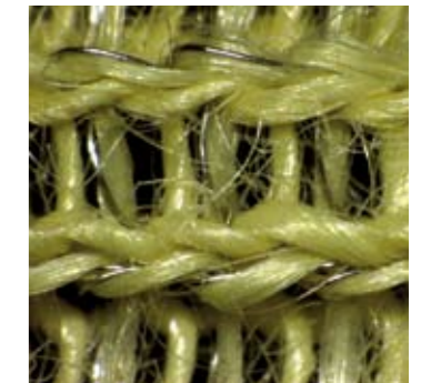
>> Schnittschutzeinlage KEVLAR® Inox