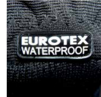
>> SAFEGUARD INOX WP – waterproof, d.h.: mit Nässesperre