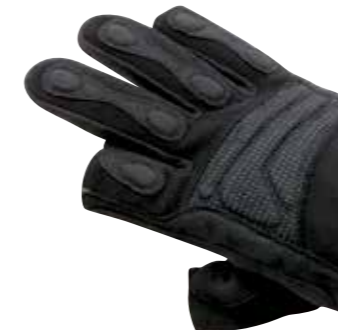
>> SAFEGUARD INOX ofF – Daumen und Zeigefinger frei

Die Spezial-Schutzhandschuhe für technische Hilfs- und Rettungsdienste.