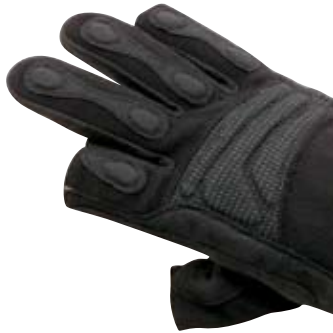
>> SAFEGUARD INOX oF – Daumen und Zeigefinger frei

Die Spezial-Schutzhandschuhe für technische Hilfs- und Rettungsdienste.