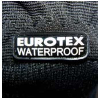
>> SAFEGUARD INOX WP – waterproof, d.h.: mit Nässesperre