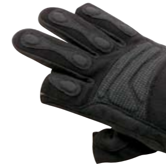
>> SAFEGUARD INOX oF – Daumen und Zeigefinger frei

Die Spezial-Schutzhandschuhe für technische Hilfs- und Rettungsdienste.