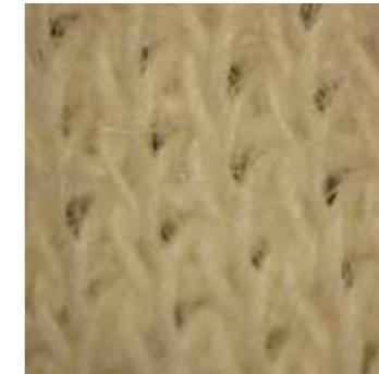
>> Schnittschutzeinlage Doubleface-Strickware