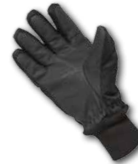
>> Innenhand aus Doubleface-Gestrick mit Silikonbeschichtung

Der textile Feuerwehrhandschuh für die Brandbekämpfung.