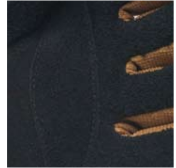
>> Innenhand: spezialgegerbtes Rindleder