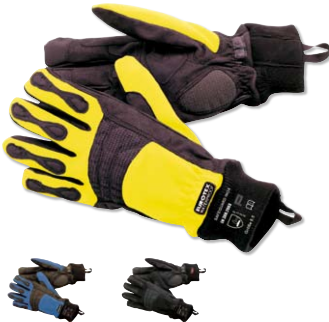
Modell: SAFEGUARD INOX