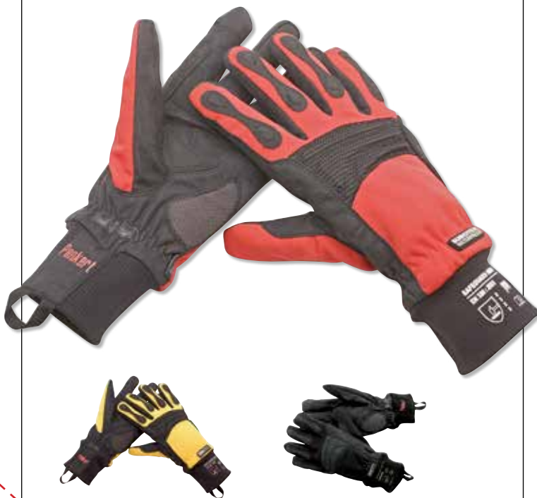
Modell: SAFEGUARD INOX WP (waterproof)